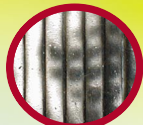
Beispielfoto, Ergebnis nach ca. 6 Monaten.